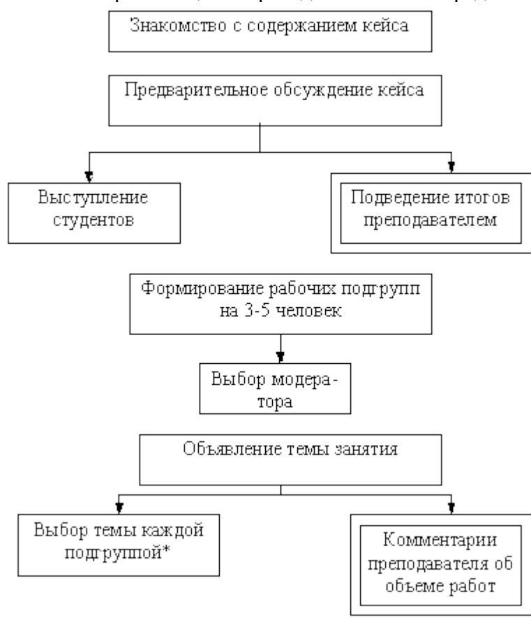
Стадия организации работы над кейсом

Последовательность организации и проведения занятий представлена на рисунках.